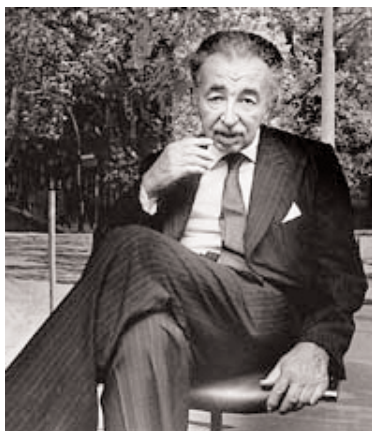
Imagen de Marcelo Diamand

de productos importados, consecuencia del aumento de costos que se propaga a los precios. Al mismo tiempo, aumentan los precios de productos agropecuarios que llevan un alza en el precio de los alimentos desencadenando así un proceso inflacionario.