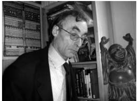
Robert Boyer en su visita a la Argentina.

Plan[h]: Luego de la avanzada neoliberal de fin de siglo cuyas consecuencias en Argentina aún se manifiestan, por ejemplo, en altos niveles de desempleo, gran parte de la población trabajando en negro, ¿se debería apuntar a la reconstrucción del Estado de Bienestar? ¿O en el nuevo contexto mundial, con nuevas características de apertura, globalización, cambio